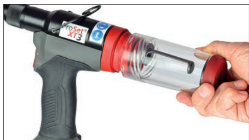
Sistema di raccolta gambi MCS a sgancio rapido

Le rivettatrici POP Avdel della gamma ProSet® XT sono dotate di diverse funzionalità innovative ad alte prestazioni, tra cui l'alloggiamento della testata e la sede ganasce a sgancio rapido brevettati "Quick Disconnect", che consentono di eseguire con rapidità la pulizia e la manutenzione dell'estremità anteriore dell'apparecchio, senza la necessità di alcun utensile aggiuntivo. Il Mandrel Collection System (MCS) (sistema di raccolta gambi) a sgancio rapido permette di raccogliere in modo sicuro i mandrini consumati per uno smaltimento semplice e veloce, mantenendo al contempo più puliti gli ambienti di lavoro. Un interruttore di isolamento dell'aria su MCS previene il flusso d'aria quando MCS è disconnesso. Un raccordo girevole di regolazione dell'aria a 90°, a sinistra o a destra fa sì che tutti gli utensili possano essere adattati a praticamente tutte le configurazioni della stazione di lavoro, mentre l'interruttore "acceso/spento" riduce al minimo il rumore e il consumo dell'aria.