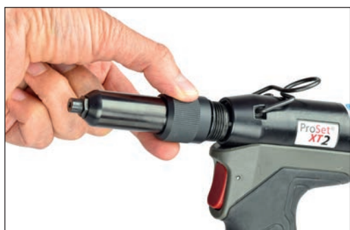
Alloggiamento della testata e sede ganasce a sgancio rapido (senza utensili)